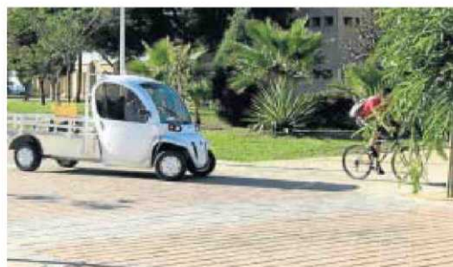
Ciclista por una de las calles de la UAL.