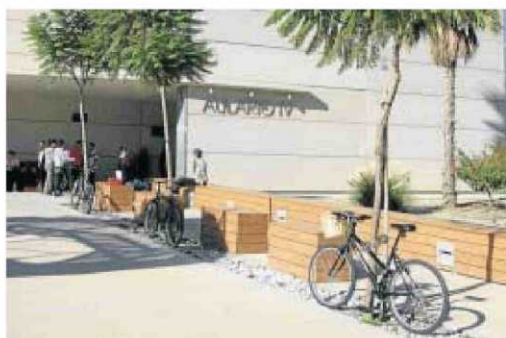
Varias bicis aparcadas frente al Aulario IV.

La Universidad de Almería fomenta la movilidad sostenible a través del Secretariado de Campus y Sostenibilidad adscrito al Vicerrectorado de Infraestructuras, Campus y Sostenibilidad. Una de las propuestas que apoya este or-