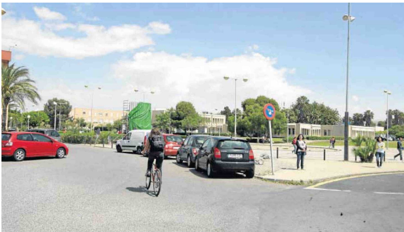
Un alumno llega a las instalaciones universitarias en su bicicleta por el acceso sur del campus.