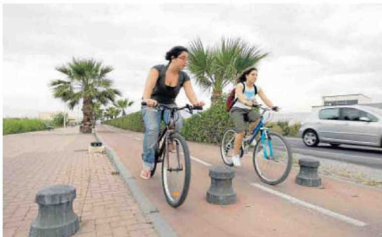
Dos alumnas acuden en bicicleta al campus de La Cañada.