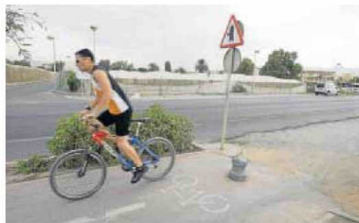
El carril bici de Paseo de Ribera llega hasta el campus.

rar el tráfico y a olvidarse de los quebraderos de cabeza a la hora de buscar aparcamientos. Por último, la utilización de la bicicleta como medio de transporte reporta beneficios para la salud de sus usuarios.