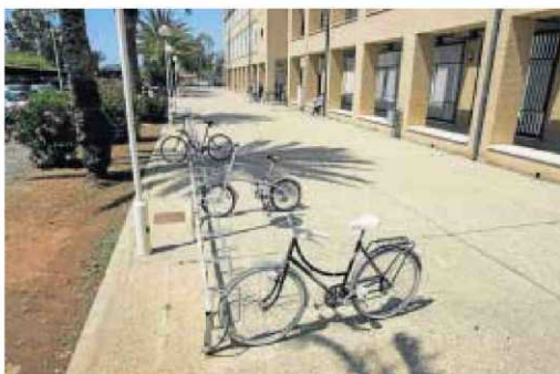
Bancada de estacionamiento frente al Aulario I.

En este curso, el préstamo de bicis se ha desarrollado a través de la Unidad de Deportes que por primera vez ha puesto en marcha la campaña de Préstamo de Bicicletas BICI 100 (préstamo de 100 días). Los primeros 25 beneficiarios ya pasean por el campus con sus bicis que deberán devolver a mediados de febrero. En esa fecha se abrirá una nueva convoca-