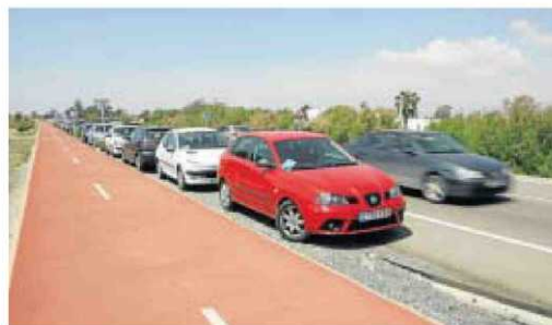
El carril bici es exclusivo para los ciclistas.