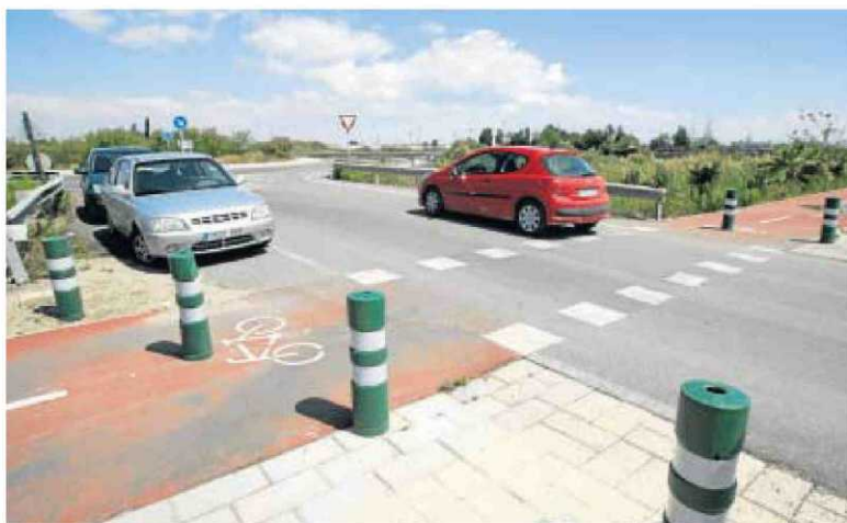
Más de 2.500 metros cuadrados rodean las instalaciones del campus.