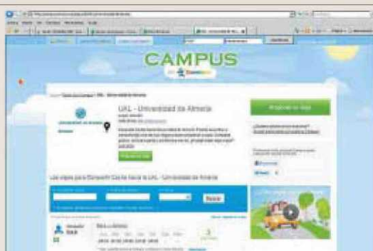
Página en la que se anuncia la Universidad.

El uso del coche compartido es otra de las propuestas en las que trabaja el Secretariado de Campus y sostenibilidad perteneciente al Vicerrectorado de Infraestructuras, Campus y Sostenibilidad. Desde hace unos meses, y así lo informan desde el secretariado, la web Comuto.es –la más importante Red Social para Compartir Coche presente en España, Francia y Reino Unido– dedica una página a la Universidad de Almería. Esta página se convierte en el punto de encuentro de las personas que quieren compartir coche y los gastos del mismo para venir a la universidad de Almería. Los estudiantes, profesores y demás personal universitario interesados en participar en esta iniciativa solo tienen que dejar sus datos como conductor o como pasaje-